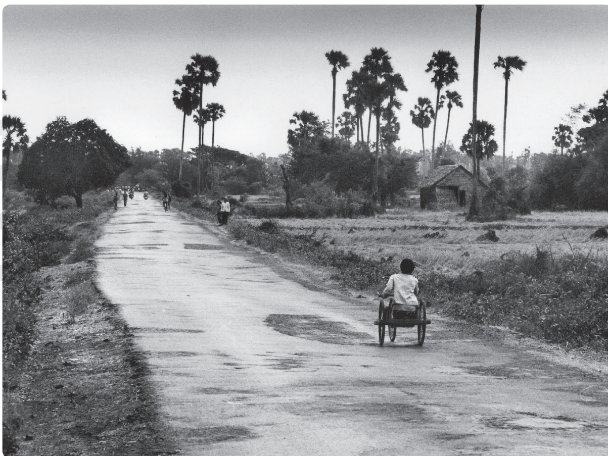
Kambodža, foto: Nic Dunlop